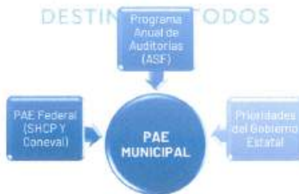
Ilustración 4. Fuentes de información para la integración del Programa Anual de Evaluación

Para determinar las intervenciones públicas que serán sujetas a evaluación se utilizan diversas fuentes de información; en primera instancia el Programa Anual de Evaluación de la Federación, ya que en él se establecen criterios de observancia estatal, así como las evaluaciones que se realizarán por las dependencias federales y que tienen un impacto en Yucatán; de igual forma se considera el Programa Anual de Auditorías de la Auditoría Superior de la Federación (ASF), ya que como parte de las auditorías (principalmente las de desempeño) se revisa que los recursos del gasto federalizado hayan sido sujetos a un proceso de evaluación; en tercer lugar, y con el fin de hacer partícipes y corresponsables a las dependencias y entidades del Gobierno del Estado de Yucatán, por último, se consideran las prioridades de gobierno , es decir, se identifican intervenciones públicas que requieren ser evaluadas con el fin de mejorar su diseño, gestión y desempeño para lograr el logro de los objetivos de los instrumentos de planeación.