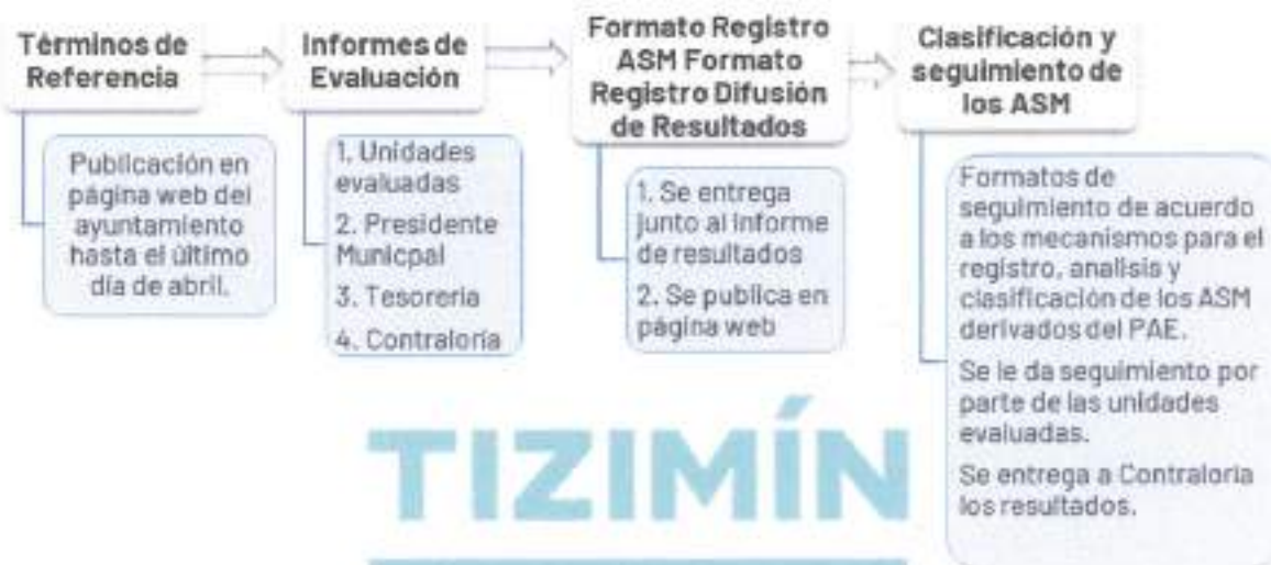
Ilustración 3. Proceso de evaluación